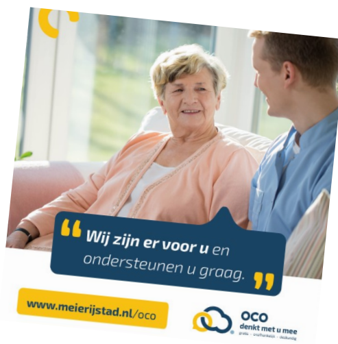
Voorbeelden banners sociale media (jeugd en ouderen)