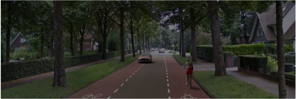
Figuur 1. Sfeerimpressie (voorbeeld in Zeist)