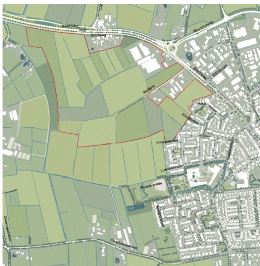
Figuur 1a Door raad vastgestelde Wvg-gebied (31 ha)

Dit heeft geleid tot vergroting van het zoekgebied buiten de Wvg begrenzing (we noemen dit het Wvg+ gebied, zie figuur 1b) als uitgangspunt voor het haalbaarheidsonderzoek (zie ook bijlage 1).