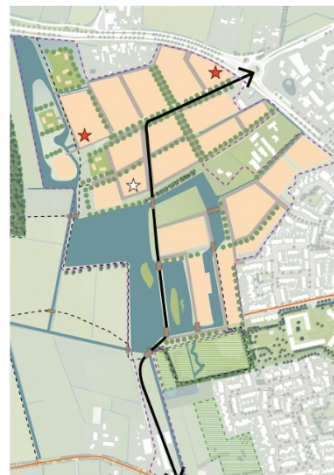
Figuur 2b Schets financieel uitgangspunt gebaseerd hele wateropgave plangebied inclusief woningbouw